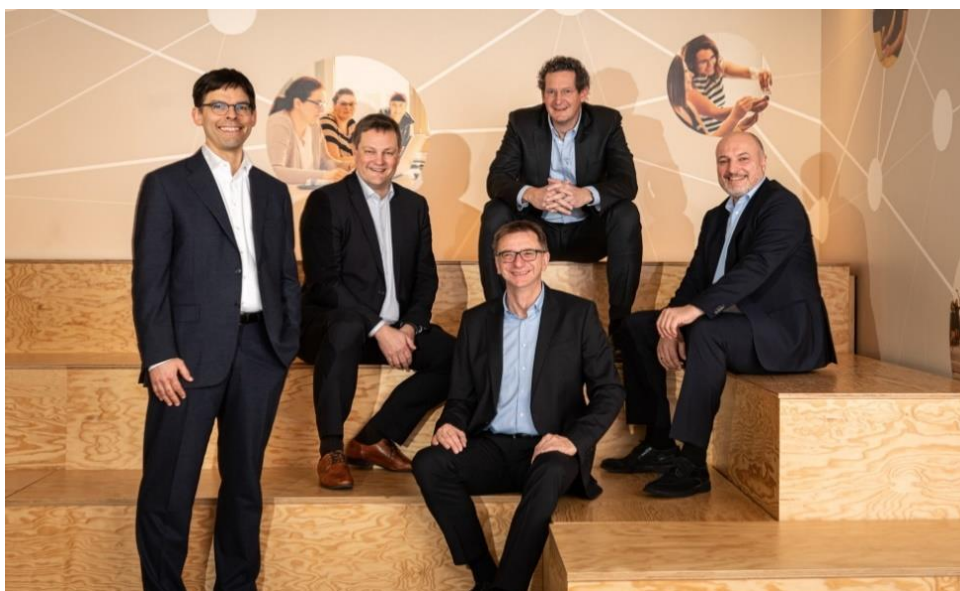
La Direction de Mercateo